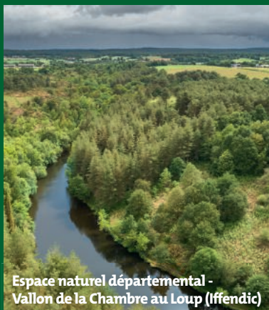
Espace naturel départemental - Vallon de la Chambre au Loup (Iffendic)

Un tour de Grouin : de la pointe du Grouin à Port-Mer • Cancale Dimanche 15 décembre • 9 h 30 • Animation LPO BRETAGNE