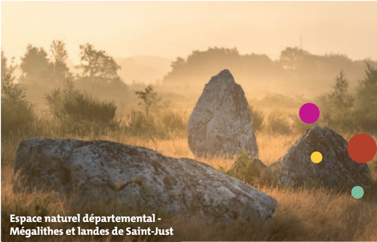
Espace naturel départemental - Mégalithes et landes de Saint-Just

Balade patrimoine à la pointe de la Garde Guérin • Saint-Briac-sur-Mer Jeudi 15 août • 14 h 00 • Animation ESCALE BRETAGNE